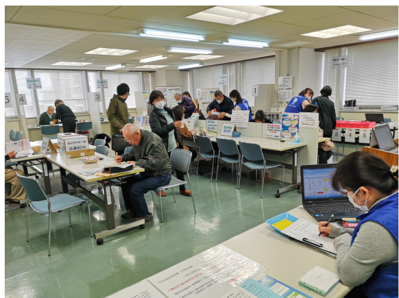
▲30年分確定申告の様子。