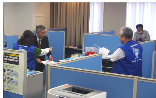
▲青色コーナーの様子（自治会館）