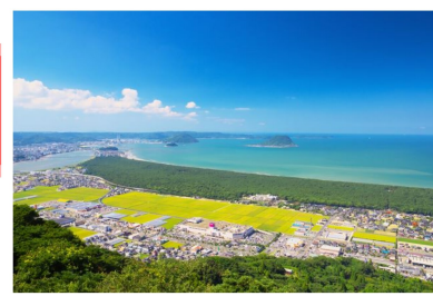
▲日本三大松原 虹の松原