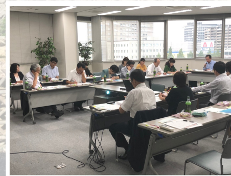
▲意見交換会の様子

7月25日、静岡県浜松市の公益社団法人浜松西青色申告会へ先進会視察へ行ってきました。浜松西青色申告会は、4582名の会員が在籍しており、東京国税局管内以外では唯一の公益社団法人です。青色21ネットワーク推奨の「ICS」を利用した決算・確定申告や、有料制のパソコンサポート、印刷した総勘定元帳を使つての記帳確認や、確定申告予約時に、会員自ら自己判定表を提出するシステムなど鹿児島会の運営とは様々な違いがあり、健全な記帳・健全な申告をスムーズに行えるよう、青色申告会と会員がしっかりと協力体制を組んでいるように感じました。その他、浜松西会の中には全青色共済専門の部署があり、同じく全青色共済勧奨に注力している鹿児島会としては大いに参考になりました。交流会の場を設けてくださった浜松西青色申告会の皆様、ありがとうございました。鹿児島会も負けないよう、会員ファーストの精神で一層会員の皆さまのサポートができるよう精進して参りますので、よろしくお願ひ致します。