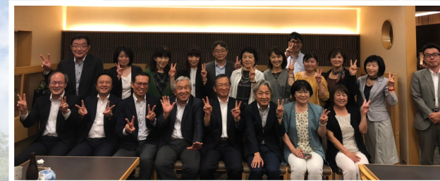
▲鹿児島会参加者と浜松西青色申告会の皆さん

7月25日、静岡県浜松市の公益社団法人浜松西青色申告会へ先進会視察へ行ってきました。浜松西青色申告会は、4582名の会員が在籍しており、東京国税局管内以外では唯一の公益社団法人です。青色21ネットワーク推奨の「ICS」を利用した決算・確定申告や、有料制のパソコンサポート、印刷した総勘定元帳を使つての記帳確認や、確定申告予約時に、会員自ら自己判定表を提出するシステムなど鹿児島会の運営とは様々な違いがあり、健全な記帳・健全な申告をスムーズに行えるよう、青色申告会と会員がしっかりと協力体制を組んでいるように感じました。その他、浜松西会の中には全青色共済専門の部署があり、同じく全青色共済勧奨に注力している鹿児島会としては大いに参考になりました。交流会の場を設けてくださった浜松西青色申告会の皆様、ありがとうございました。鹿児島会も負けないよう、会員ファーストの精神で一層会員の皆さまのサポートができるよう精進して参りますので、よろしくお願ひ致します。