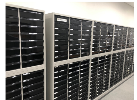
▲共済の顧客情報管理するスペース