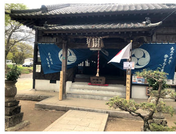
▲「令和」ゆかりの坂本八幡宮