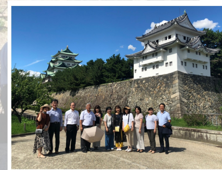
▲名古屋城も見学しました。