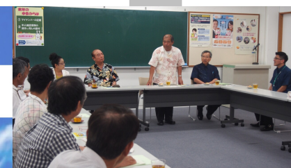
⑦沖縄納税研修会館