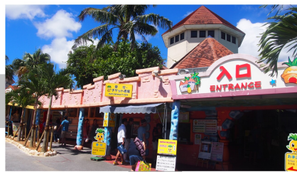
②パイナップルパーク