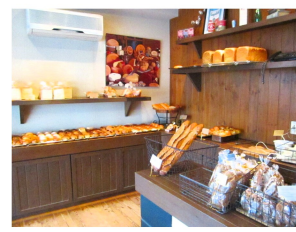
▲朝5時から仕込み。8時には開店して焼き立てを提供しています。