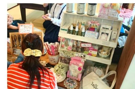
▲モデルルームでの出張出店の様子。

子供に手がかり育児をしながらできる仕事をと考えました。もともと好きだったアロマセラピイの資格を取得し起業しました。