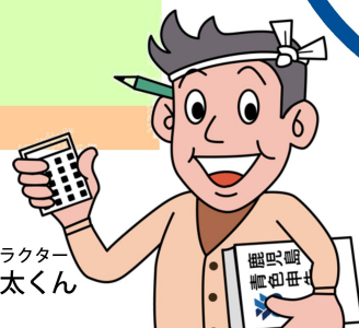
イメージキャラクター 帳面つけ太くん

また、例えば、この広報紙青空通信も会員で作っています！あーでもない、こーでもない、毎回色々な意見を出しながら和気あいあいと楽しくやっています。ぜひ、一緒に広報紙を作ってみませんか？