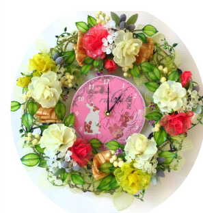
▲アメリカンフラワーは要予約。

帳簿の書き方を親切丁寧に指導して頂きとても助かっていました。今では確定申告を自分で出来るようになり、少しだけ自信ができました。会員参加の「勉強会」があると聞きしたので、時間の許す限り参加し、事業に活かしたいです。