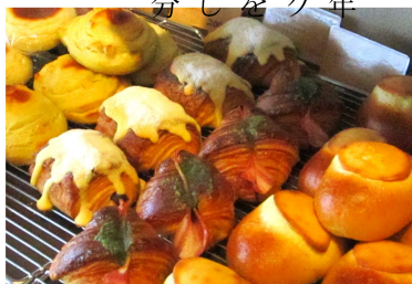
▲おすすめのクロワッサンは大変好評!毎日3,40種類のパンが立ち並びます

6年前に開店。創業110年の老舗ベーカリー神戸のドンク(DONQ)、料理にも興味を持ち城山観光ホテルでも修行しました。とにかく30歳で自分の店を持つ夢が実現しました。 起業のきっかけ 勧めます。妻はイベント出店で頑張ってくれています。勉強会には妻にも参加してもらって、税や経営面などたくさん勉強していきたくです。