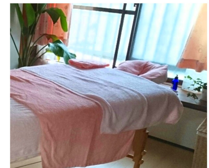
▲アロマトリートメントは心身のストレス緩和に(要予約・30分コースと60分コース)

帳簿の書き方を親切丁寧に指導して頂きとても助かっていました。今では確定申告を自分で出来るようになり、少しだけ自信ができました。会員参加の「勉強会」があると聞きしたので、時間の許す限り参加し、事業に活かしたいです。