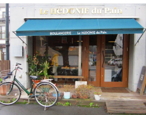
ルドニデュパン 8:00~19:00(売切次第終了) TEL 099-250-7223