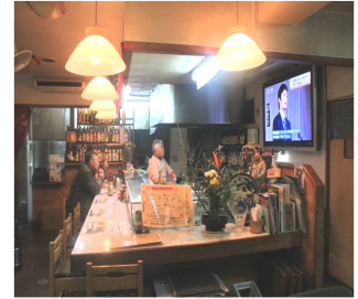
昭和な雰囲気の店内

ところでこのロッキーはいつから? 「こん店は36才で脱サラして、昭和50年10月10日、こん人の誕生日に始めました。」いかにも夫を支える優しい笑顔で奥さんが横から答えてくれる。10年食堂をして、税務署の調査を受け、自家消費分を計上し忘れ、500万の申告漏れを指摘されたが、故意ではないと説明し、5万円の税金を納め、やめようかと思った商売を居酒屋で再開出来たという。「それから税理士さんに頼んだりしましたが、今度から青色申告会にお世話になることに…」と言ってホッとした表情に。