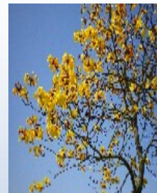
ブラジルの国花イペー

ブラジル全国民はCPF (Cadastro de Pessoa Física)、個人の納税者番号を持っていて個人で大きな買い物をする場合CPFからSERASA (不渡り小切手オンライン情報) のブラックリストに入っていないかをチェックされます。市場調査の場合、CNPJから支社・支店のデータが得られます。CPFやCNPJを使って個人・企業の税金滞納がわかる仕組み。ブラジルは2011年から電子申告 (e-tax) が義務付けられていて、ブラジル国税庁サイトからその作成と提出にプログラムをダウンロードし電子申告します。会社員でも各自が確定申告 (年末調整) をしなければならない。