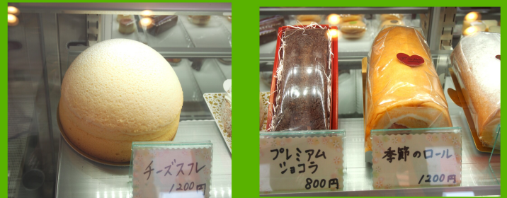
▲ チーズスプレは1日1個限定。やみつきになるやわらかさだ。