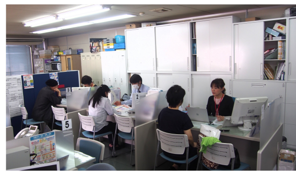
▲29年分確定申告の様子。30年度の会計はすすんでいますか? 本年度も事務局がサポート致します!