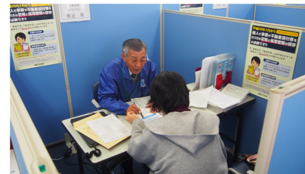
▲青色コーナーの様子(自治会館)