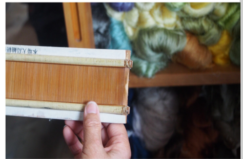
▲ 「箆羽(おさば)」に「箆(おさ)」の間隙を40cmおき、1組の糸を通す。1,400本の糸を通す。