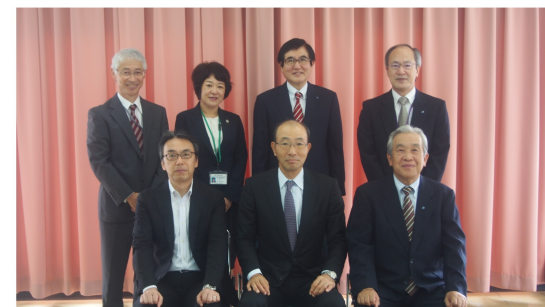
▲ 国税庁長官藤井健志氏（前列中央）、熊本国税局長松本洋明氏（前列左）、全国青色申告会総連合会長八坂泰司（前列右）