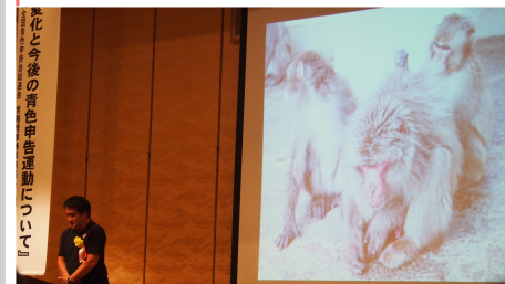
▲強いサルがボスとは限らないとのこと