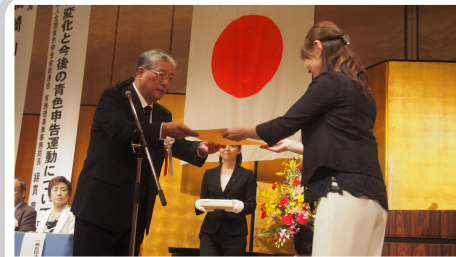
▲永年勤続役員表彰の様子