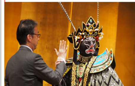
▲元は中国伝統芸能の変面ショー