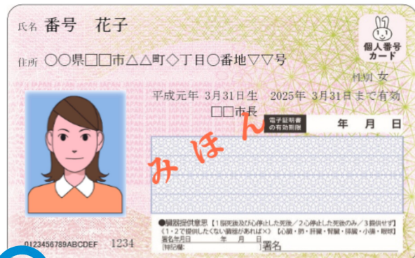
マイナンバーカード（個人番号カード）