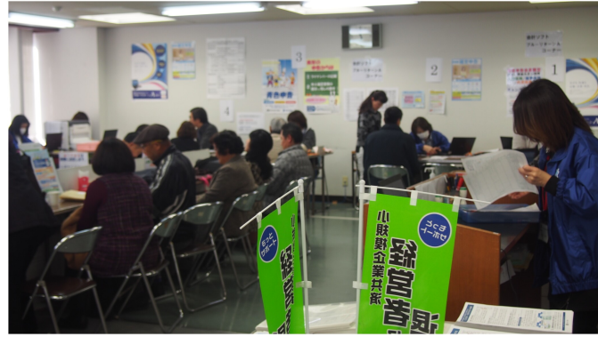
▲平成29年度分確定申告個別相談会場（鹿児島県産業会館）

また、鹿児島青色申告会では、2月1日より電子申告を受け付けます。ブルーリターンAをご利用されている方につきましては、事前の記帳チェックがオススメです。年末から申告期にかけて混雑が予想されます。早めのご予約をよろしくお願い致します。